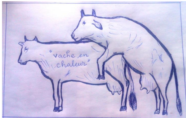
Image d'une vache après ovulation et qui présente les signes suivants :